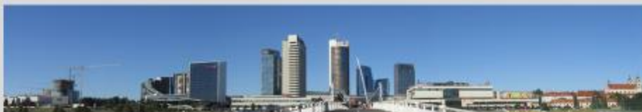
Aukštybinių pastatų kalva Vilniuje