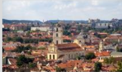
Vilniaus istorinis centras – Pasaulio paveldo sąrašė