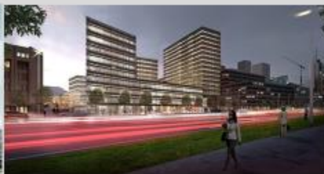
Schmidt Hammer Lassen Architects