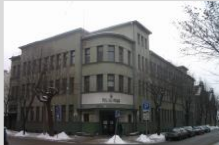
Kauno modernizmas – Europos paveldo sąrašė