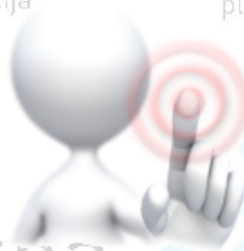
Lietuvos nekilnojamojo turto plėtros asociacija