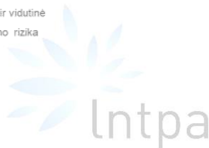
Lietuvos nekilnojamojo turto plėtros asociacija i CREDITINFO cija