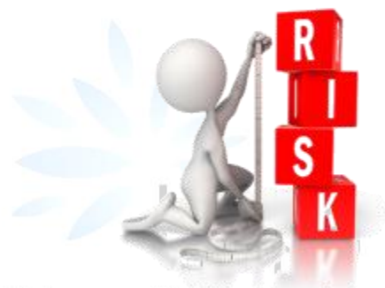
Lietuvos nekilnojamojo turto plėtros asociacija

8 iš 10 Lietuvos gyventojų turi gerą ir vidutinę kredito istoriją