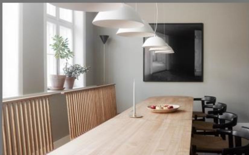
Interjere svarbiausias pojūtis

Lietuvos nekilnojamojo turto plėtros asociacija