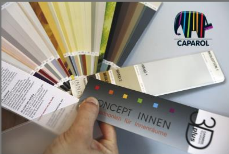
Caparol 3D Concept Innen paletė

Lietuvos nekilnojamojo turto plėtros asociacija